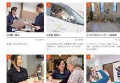
貴社の働き方を写真やメッセージでご紹介します

無料職業紹介にお申し込みいただいた企業・求人は、仙台・宮城の就職活動ポータルサイト「ジョブ・スタ せんだい」でご紹介します。このページでは学生・求職者に対して『働き方』が伝わるよう、情報を掲載しています。