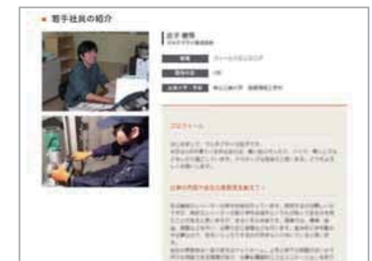
先輩社員のインタビュー記事も掲載することができます