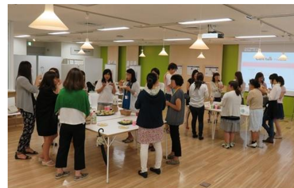
ランチ交流会の様子