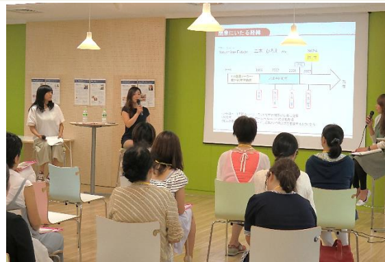
トークセッションの様子