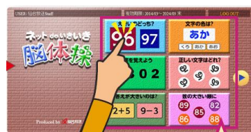
高齢者施設向け いきいき脳体操