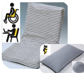
らっぶあっぶ 座布団