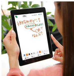
iPad/Android 用 手書き電話