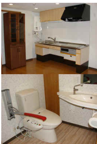
高齢者が自立して暮らすための 既存マンションのリフォーム (株式会社深松組)