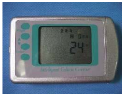
インテリジェント・カロリー・カウンター 高齢者用アルゴリズム【他製品に応用】 (株式会社アイ・ティ・リサーチ)