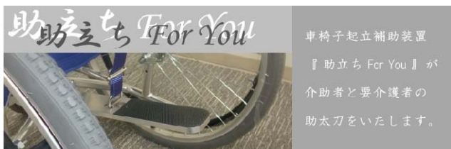
車椅子起立補助装置 助立ち For You (株式会社邦友)