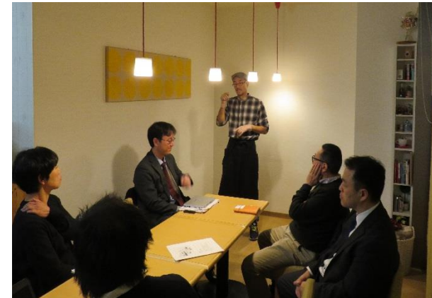
井形オーナーからの体験に基づくアドバイスに皆さん、熱心に耳を傾けていました。