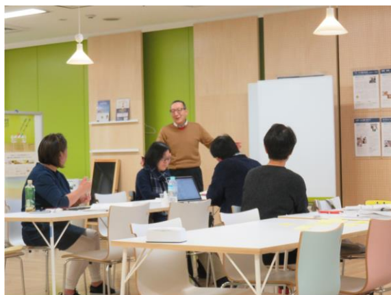
各自作成した事業プランについて意見交換を行いました。