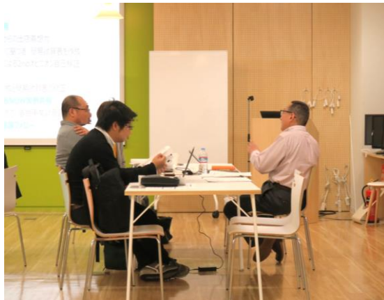
少人数ならではの個別具体的なアドバイス。